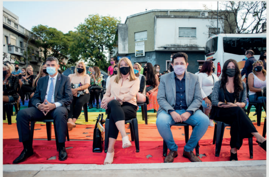
Presentación del proyecto de ordenanza "Paseo del Activismo y la Memoria Trans y Travesti". Marzo 2021

El Concejo Deliberante se encuentra en la incorporación de legislación, recomendaciones, pautas y recursos que permitan avanzar en la transversalización de la perspectiva de género y diversidades para el diseño e implementación de normativa que implique sensibilización, capacitación y formación en la temática.